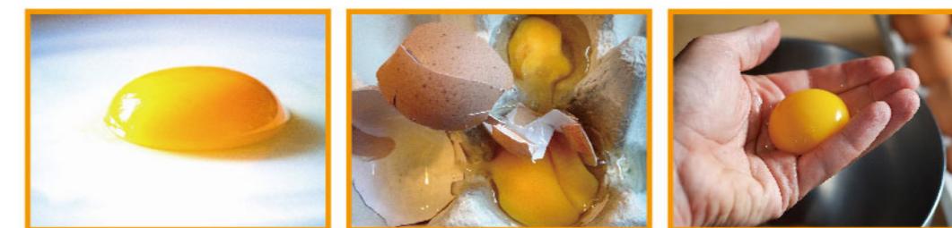
精製硫飼料——餵飼3周後 一般的蛋(蛋黃易破) 即使用手拿，蛋黃也不容易破