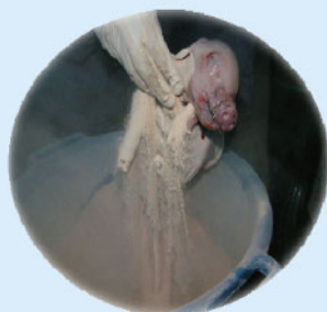
將剛出生的仔豬立即浸入添加撲樂的桶子中