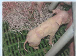
使用過撲樂4分鐘後， 仔豬已能攝取到初乳。

成分 碳酸鈣 · 磷酸氫鈣 · 天然芳香物質混合物(松木和桉木) · 矽酸鎂 · 玉米蕊