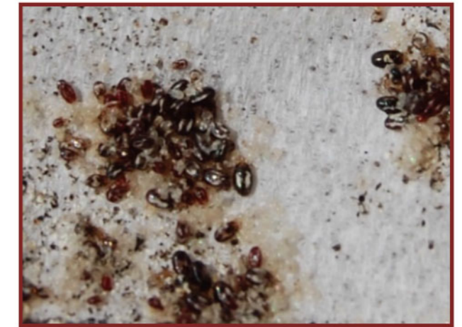
▲ 使用蟎寧後，紅蟎由於無法消化血液，顏色呈現暗色。