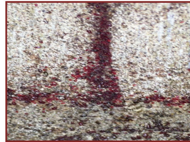
▲ 使用蟎寧前，紅蟎吸血後呈紅色。